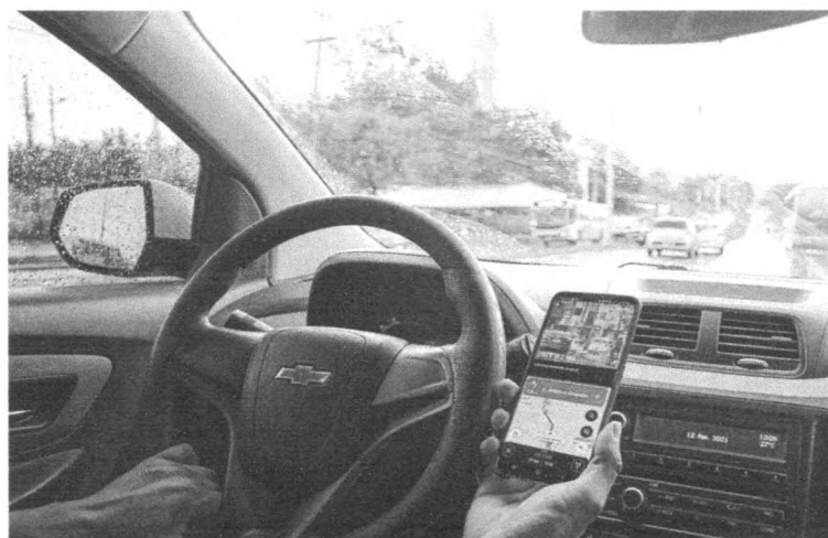
Com aplicativo de mensagens, categoria consegue monitorar a corrida dos colegas de trabalho na ilha e evitar assaltos e mortes